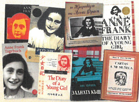
Het dagboek is in meer dan 70 talen vertaald.